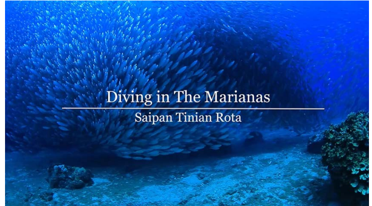
Diving in The Marianas Saipan Tinian Rota

当動画では、何万匹というアジの群れがトルネードのように遊泳するラウラウビーチや、神秘的な青の世界に包まれる洞窟ポイントのグロット、純白の砂地が美しいオプジャンビーチ、60mまで落ち込む豪快なドロップオフポイントのフレミング、スポットライトのように射し込む光のカーテンが美しいロタホールなど、全21ポイントをご紹介します。想像をはるかに超える、美しいマリアナの水中絶景は、まさに感動と驚きの連続です。