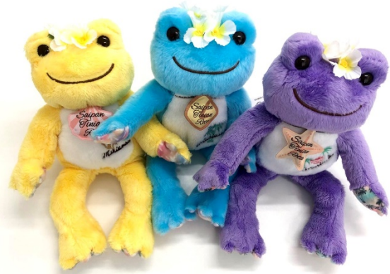
一番右がマリアナシリーズ3回目の「マリアナ×ピクルス3」

また、コラボレーション商品「マリアナ×ピクルス3」の発売を記念して今年も、 サイパン旅行が当たるInstagram投稿キャンペーン が実施されます。