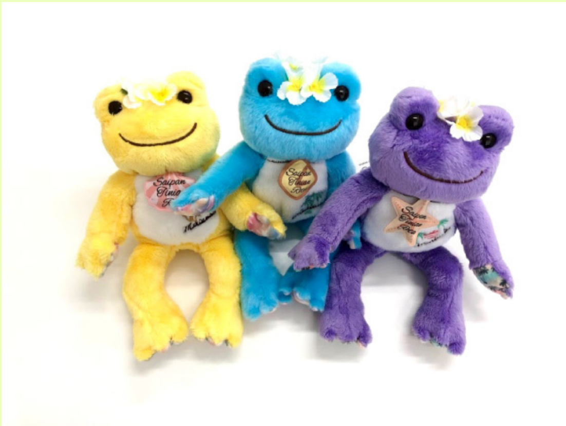
一番右がマリアナシリーズ3回目の「マリアナ×ピクルス3」