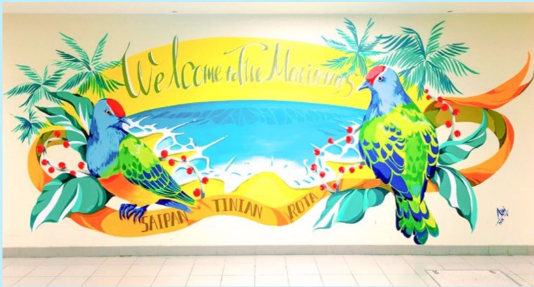
②タイキ&アミ”コラボ”アート イノス平和公園