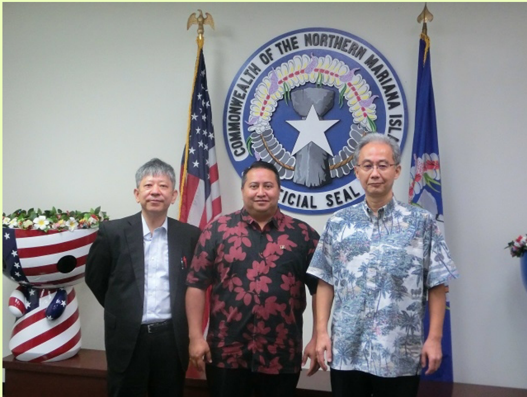
写真：左から高垣所長、北マリアナ トーレス知事、小林総領事